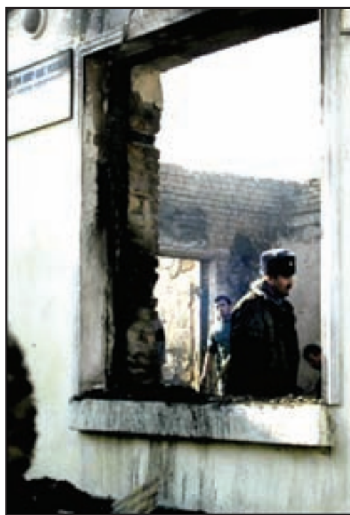
Un investigador special ta inspecciona e causa di e candela.

DUSHANBE—Diestres mucha a muri diasabra anochi, den un candela den un internat pa muchanan handicap psiquico na Dushanbe, capital di Tayikistan, segun fuentenan di polis.